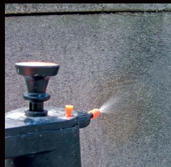
Aplikace materiálu SOLUZIONE COMBAT nástřikem