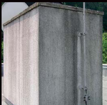
Původní znečištěný povrch