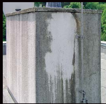
Po několika minutách opláchnout dostatečným množstvím vody