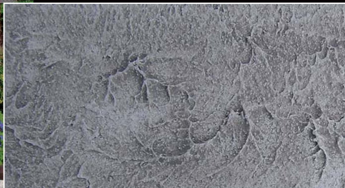
RASAKOLL MINERALE (dřevěné hladítko)