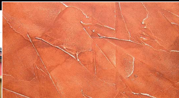
RASAKOLL MINERALE (špachtlování)