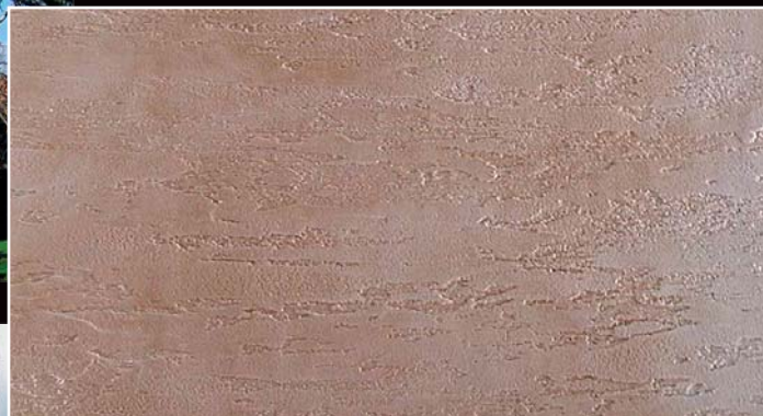
RASAKOLL MINERALE (efekt Travertino)