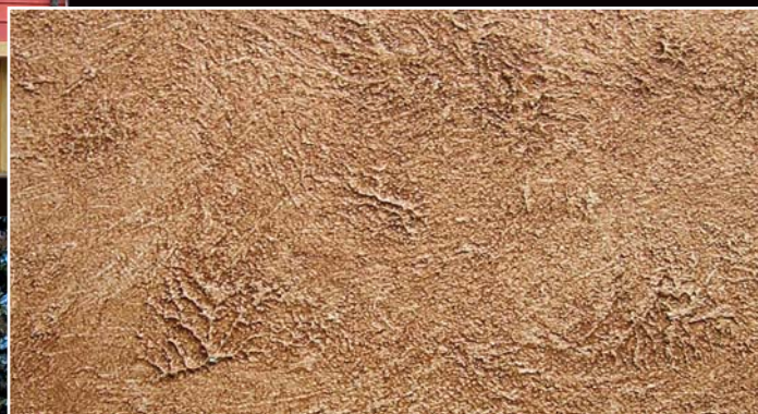
RASAKOLL MINERALE + SILOX VEL